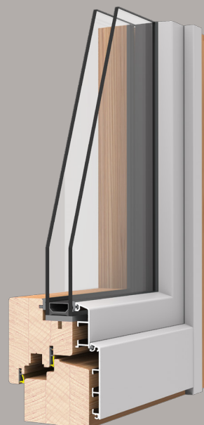
Sistema Easy-Light 68x81 design lineare e linee squadrate

Il sistema Easy-Light 68x81 è stato progettato per la posa a muro in battuta. il telaio in alluminio di dimensione ridotta e assemblato a 90° consente un sensibile risparmio sul costo del rivestimento.